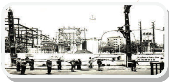
Subestação de rede elétrica no bairro Aldeota, Fortaleza-CE.