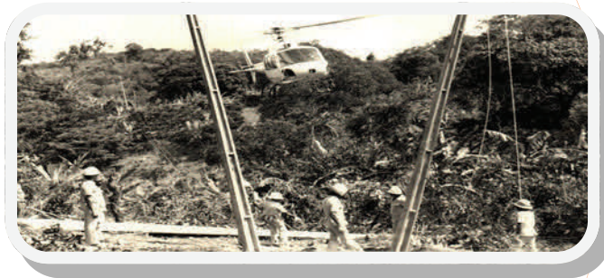
Trabalhadores instalando rede elétrica no Ceará. Destaque para o primeiro helicóptero adquirido pela Coelce.

As práticas de regulação, produção e usos da energia elétrica no Ceará remontam a meados do século XIX, na cidade de Fortaleza, momento em que aspirava-se por novas técnicas que contribuíssem para sua organização estrutural e o crescimento social e econômico da Província do Ceará. Esse mesmo anseio chega aos nossos dias com as ações da Coelce, empresa responsável pela distribuição da energia elétrica do Estado do Ceará.