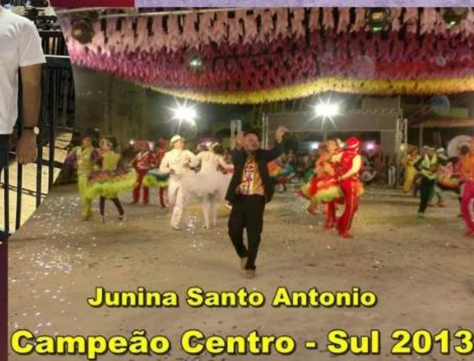
Junina Santo Antonio Campeão Centro - Sul 2013