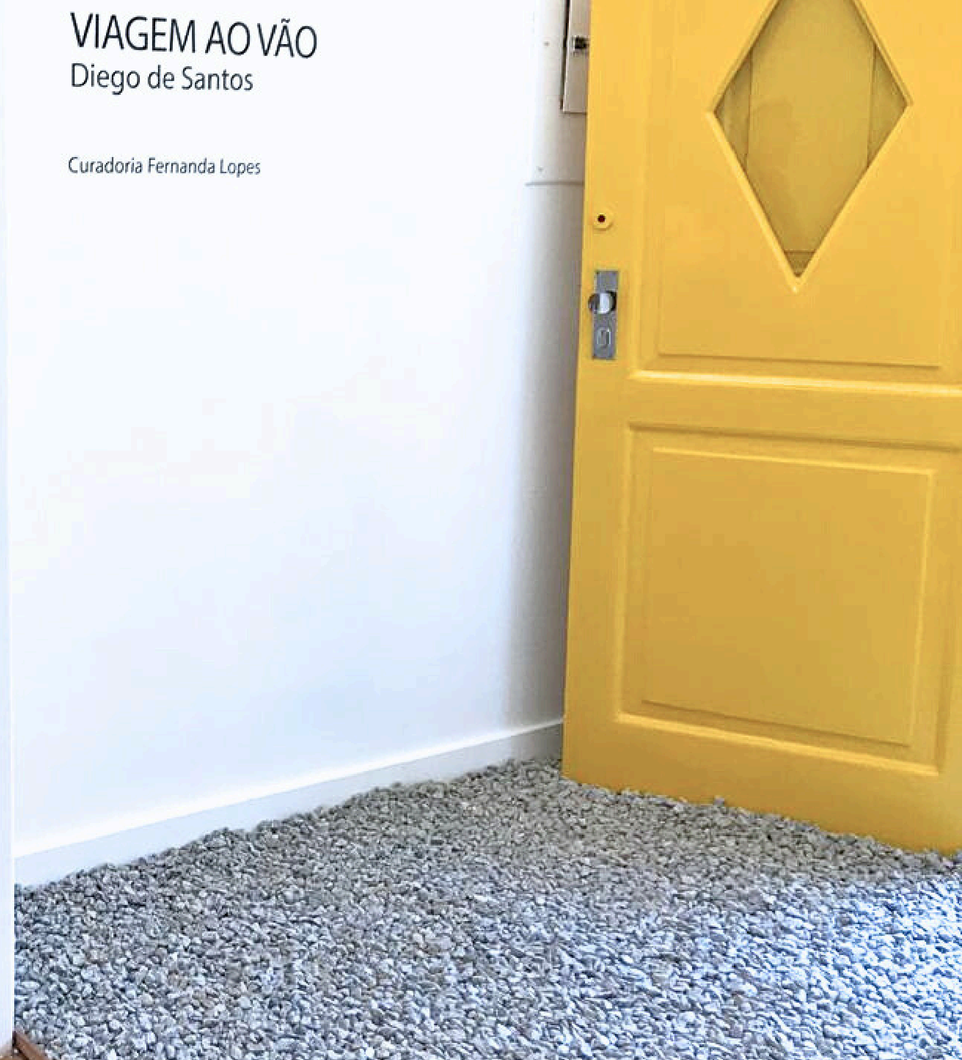
Vista da exposição Viagem ao Vão, C. Galeria, Rio de Janeiro.