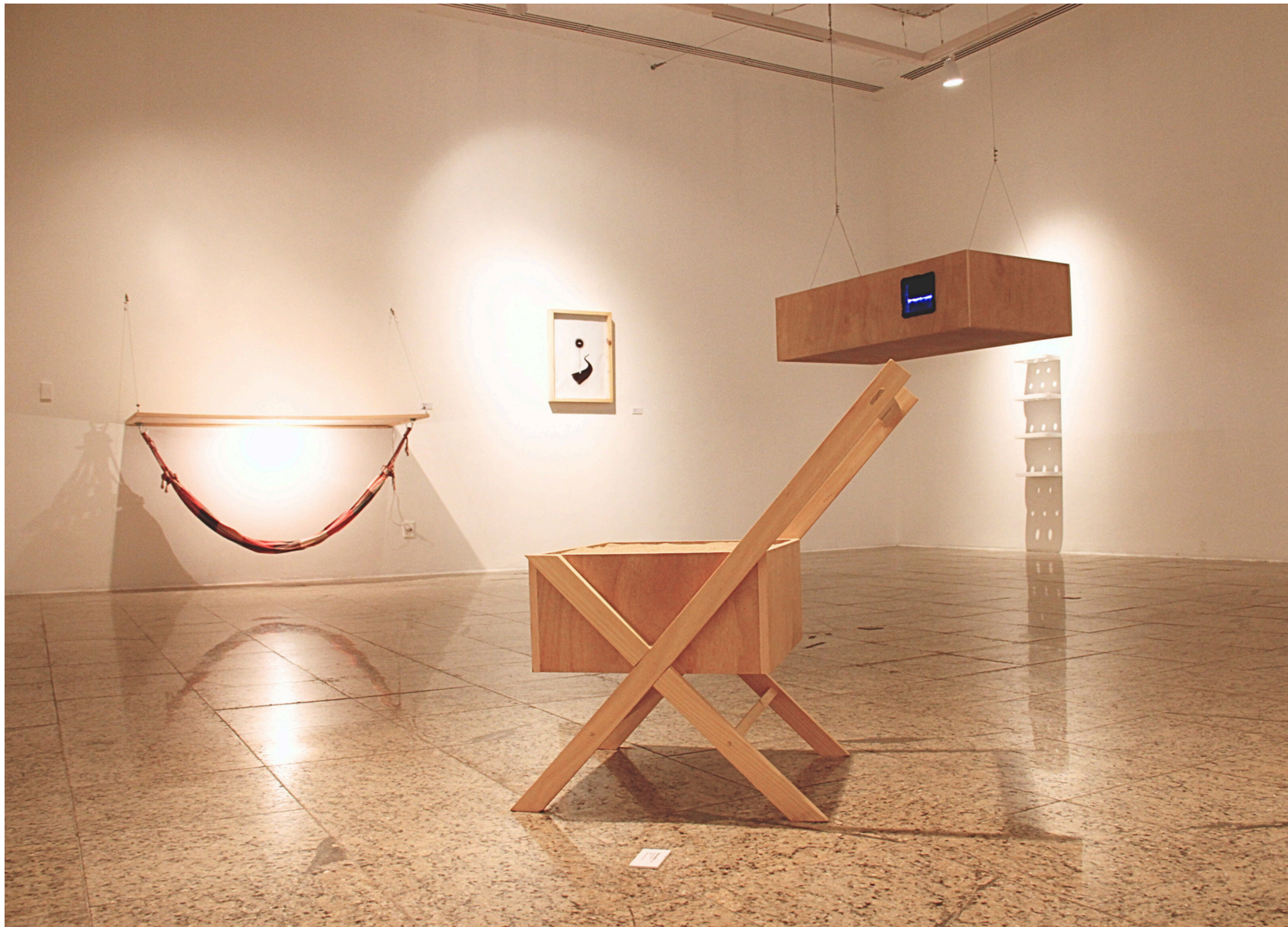
Vista da exposição Lar é Onde Ele Está, Museu de Arte Contemporânea do Ceará, 2014.