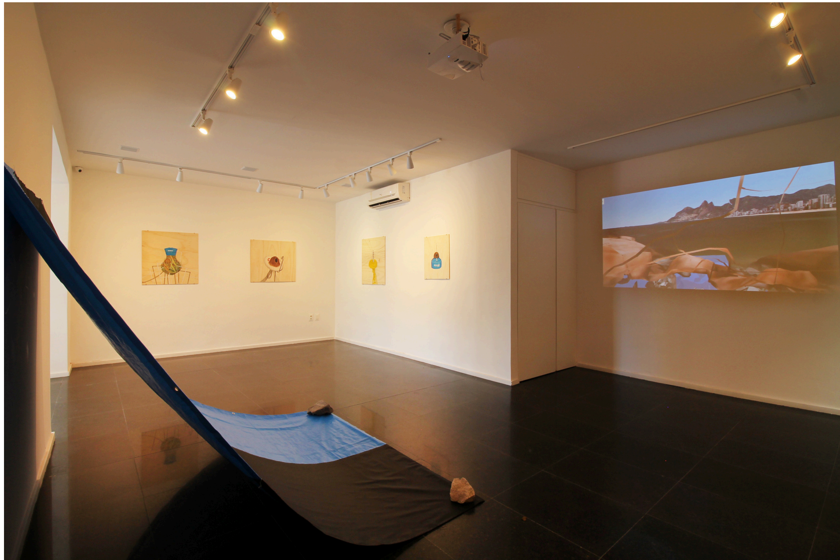
Vista da exposição Fato Atípico e Outros Delitos Existenciais, Sem Título Arte, Fortaleza, 2019.