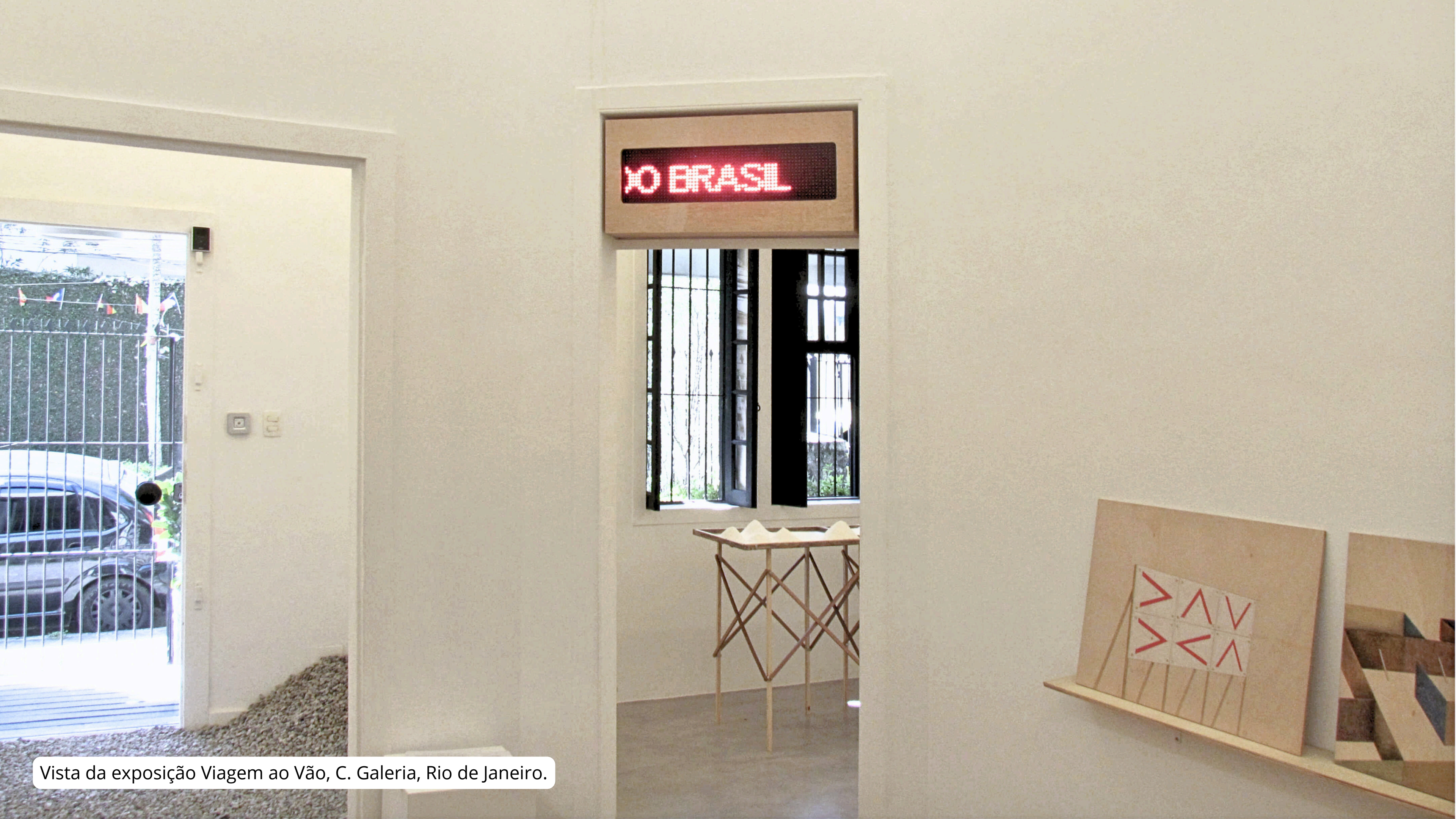
Vista da exposição Viagem ao Vão, C. Galeria, Rio de Janeiro.