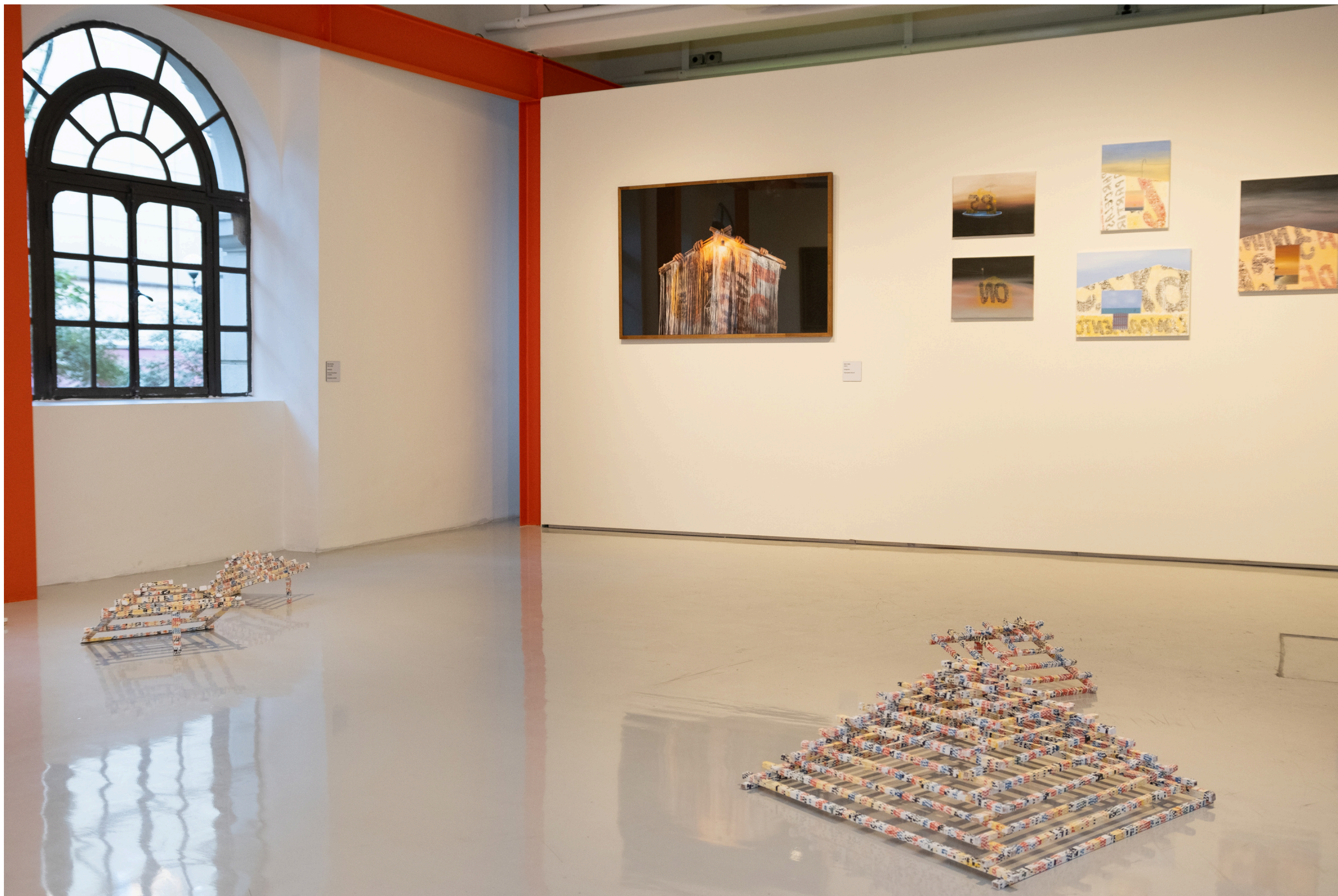
Vista da exposição Lost na Região, Paço das Artes, São Paulo, 2023.