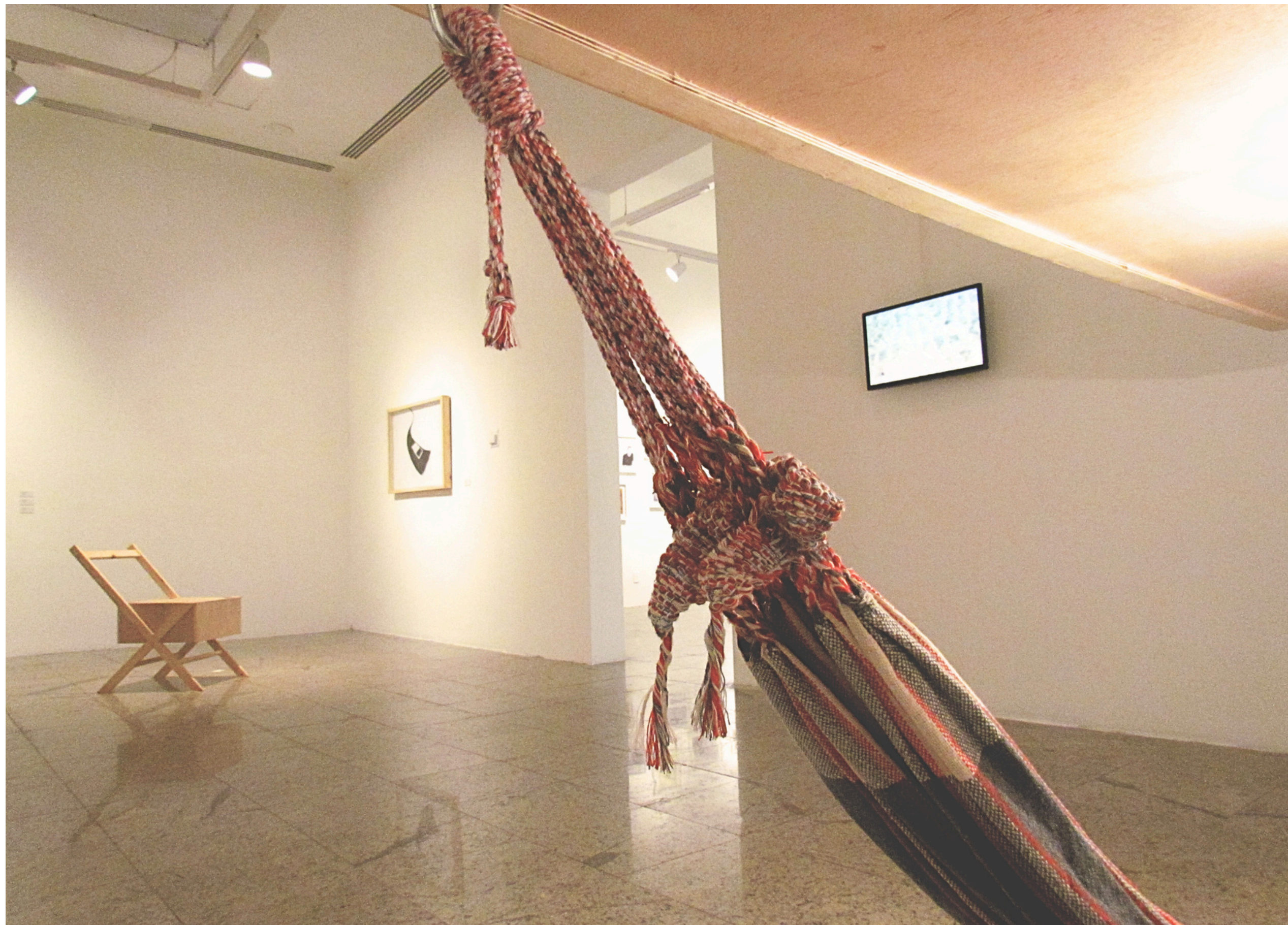
Vista da exposição Lar é Onde Ele Está, Museu de Arte Contemporânea do Ceará, 2014.