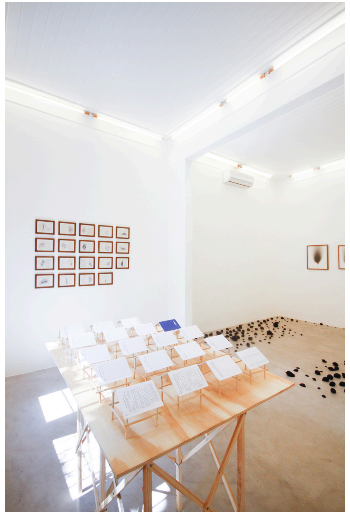
Vista da exposição Qualquer Brisa Verga, C. Galeria, Rio de Janeiro, 2023.