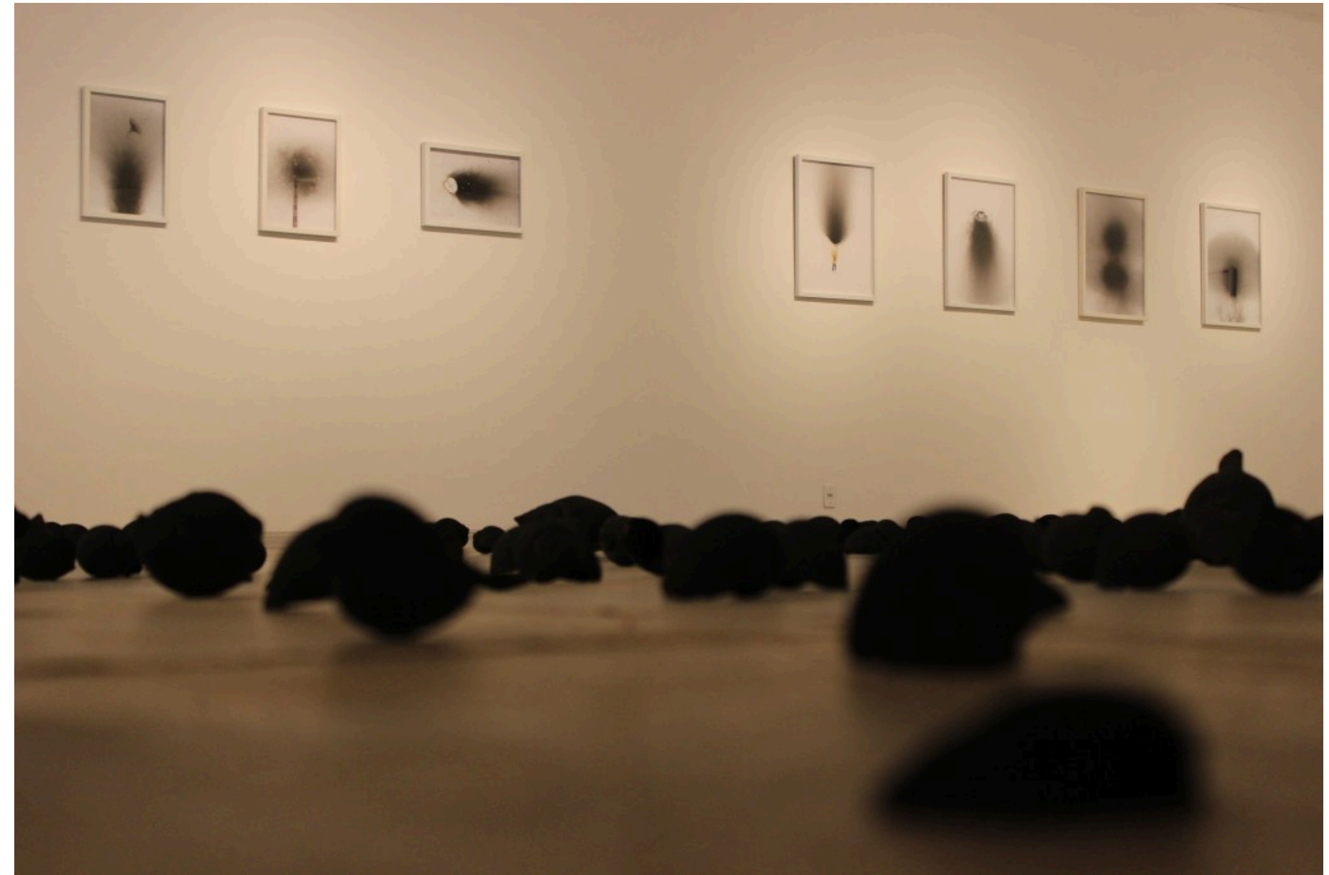
Vista da exposição Poema 193, Funarte Brasília, 2017.