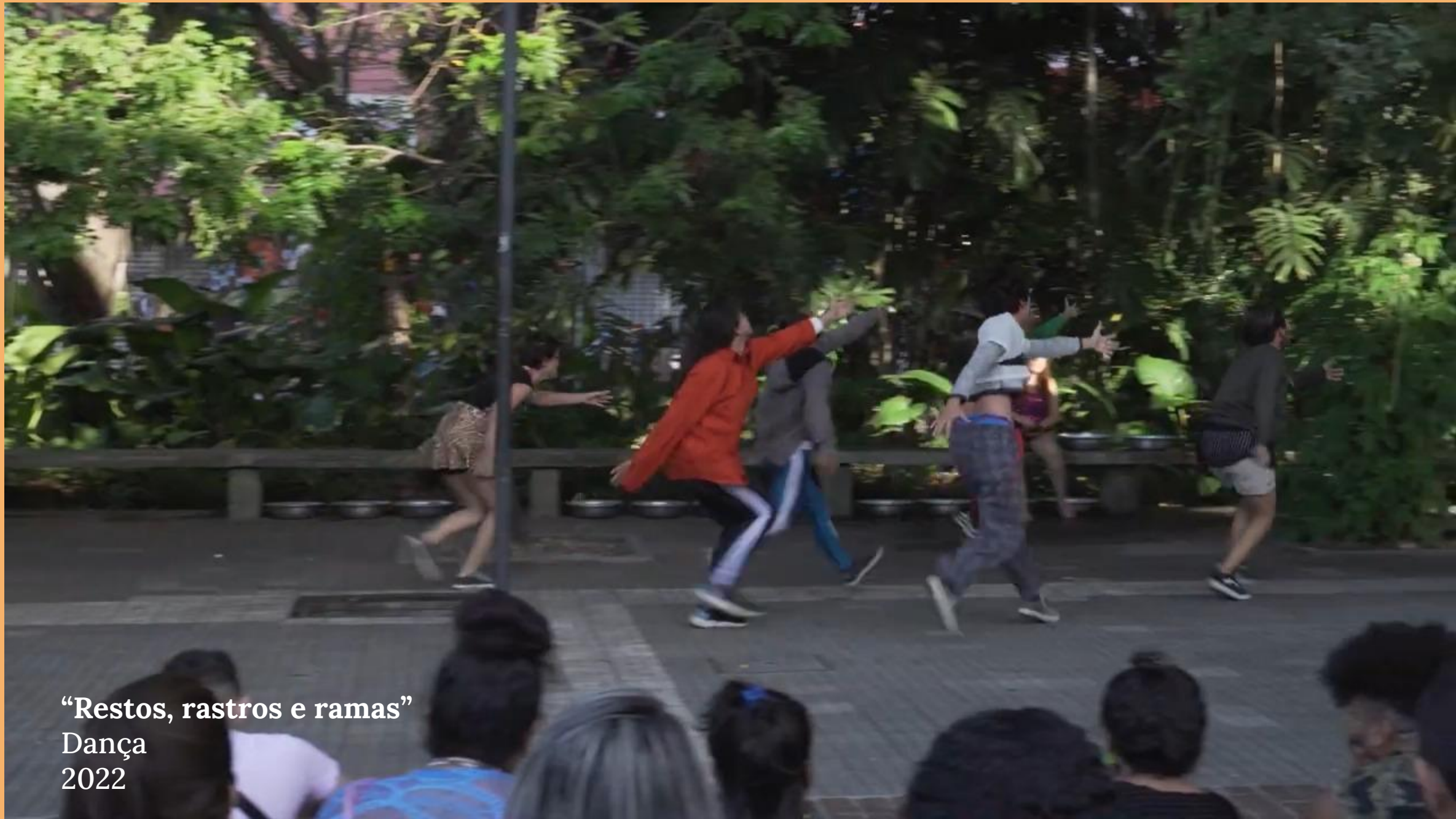
“Restos, rastros e ramas” Dança 2022