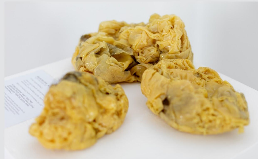
MARCELINA ACÁCIO série DESCARREGO

SUMÁRIO // INDEX + MAIS INFORMAÇÕES // MORE INFORMATION +