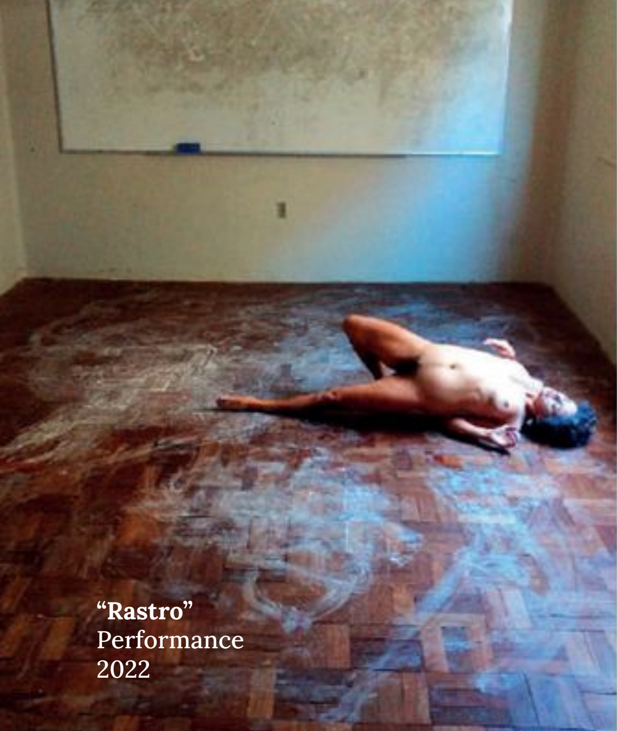
“Rastro” Performance 2022