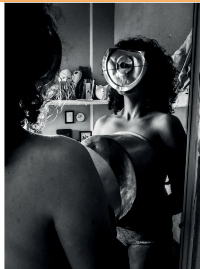
“Abram as janelas Fotografia 2020