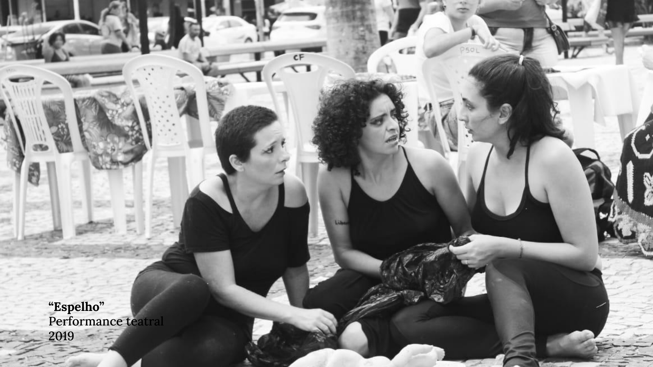
“Espelho” Performance teatral 2019