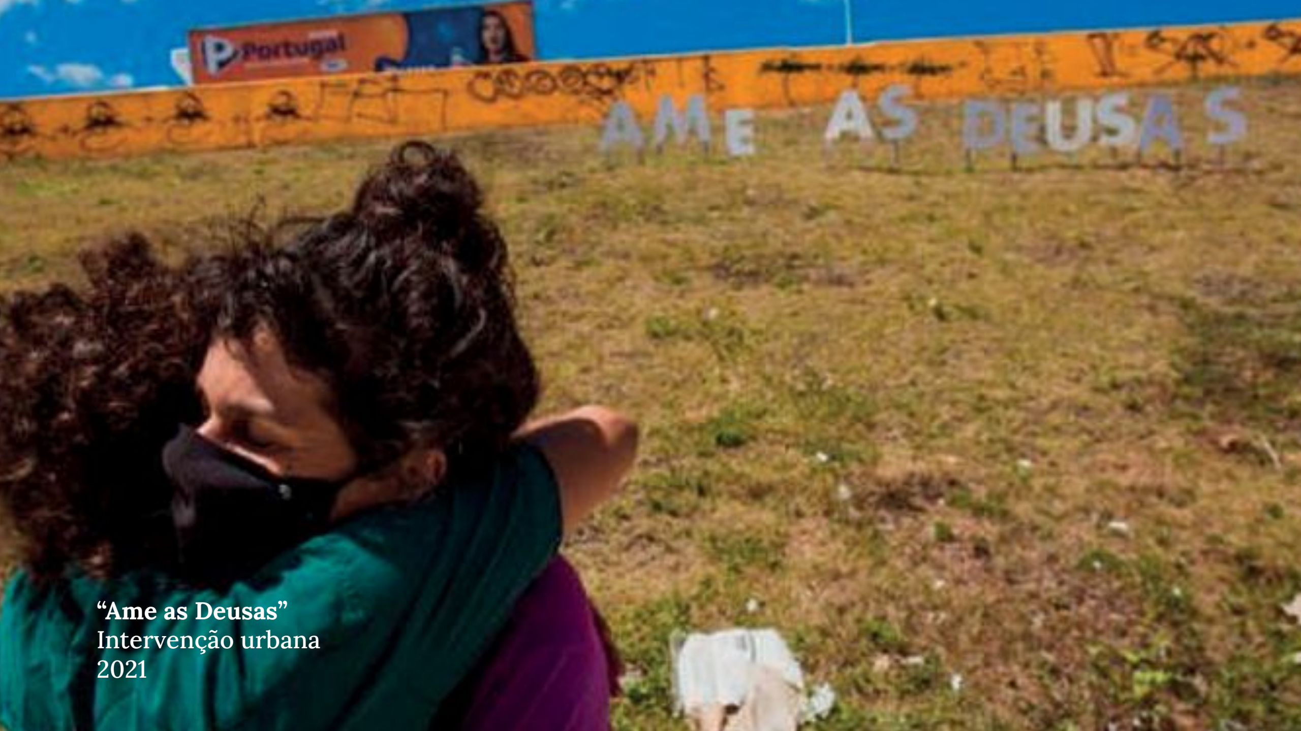
“Ame as Deusas” Intervenção urbana 2021