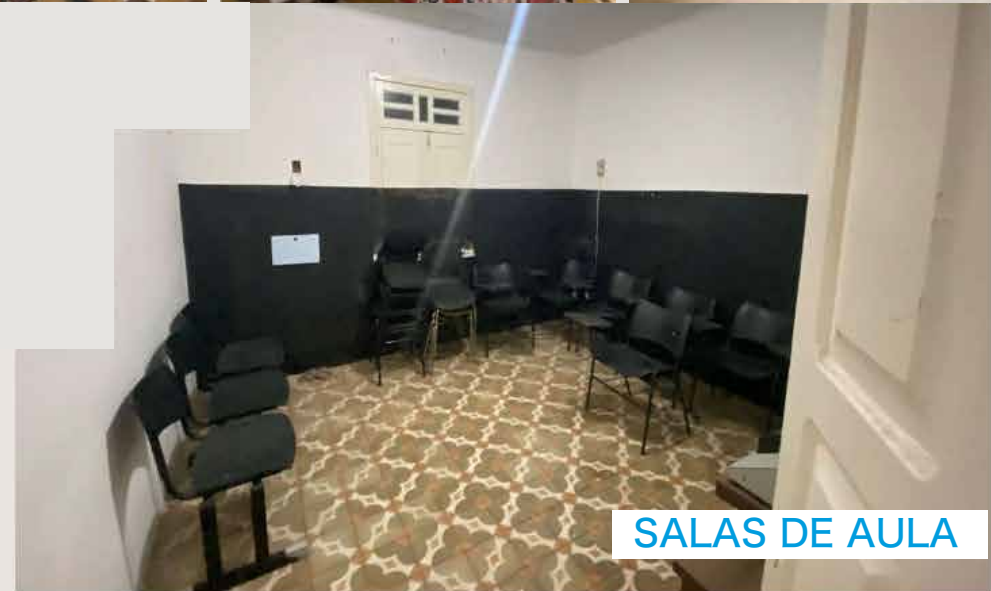
SALAS DE AULA