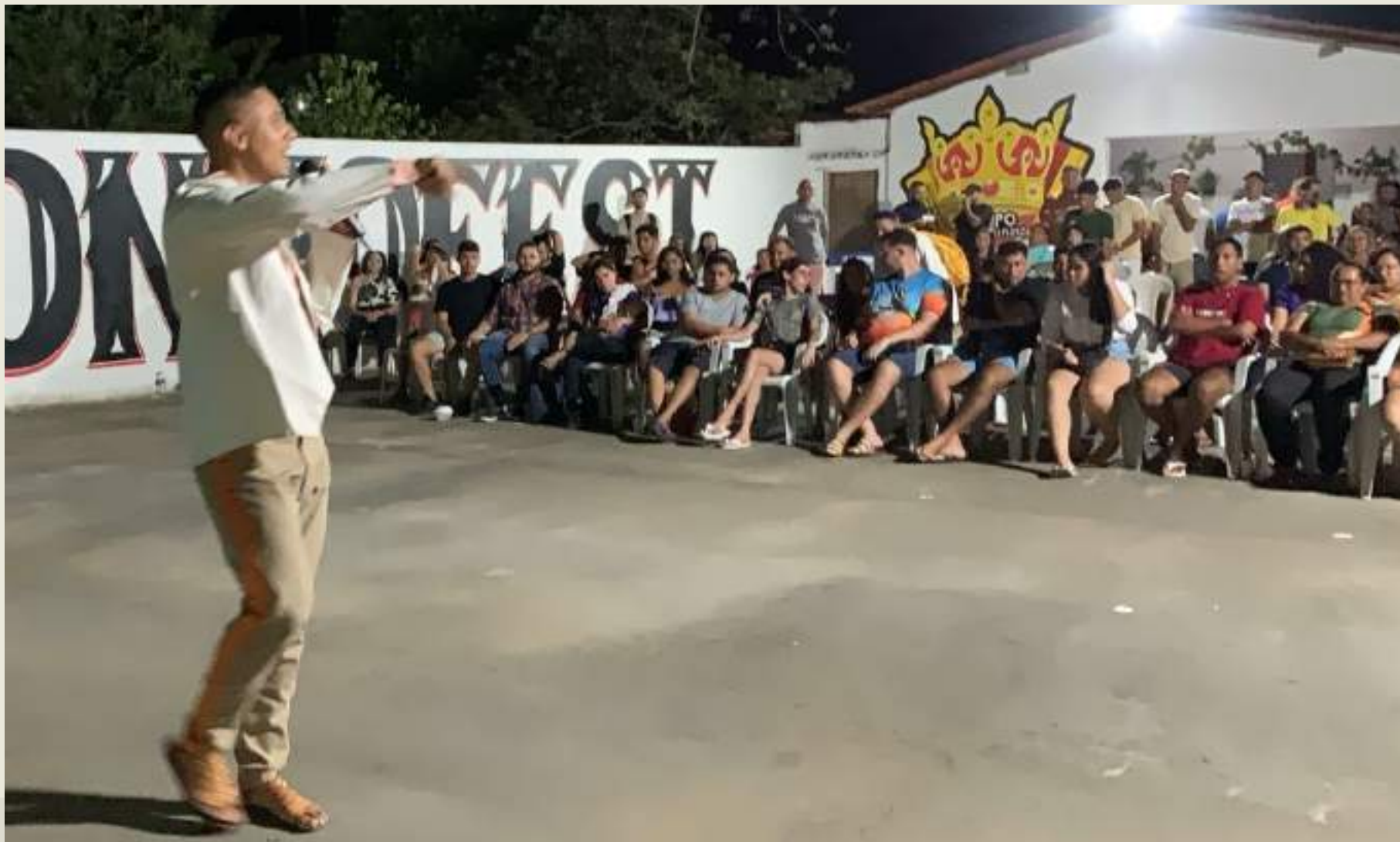
Festa de Lançamento Grupo Sonho Real - 2024