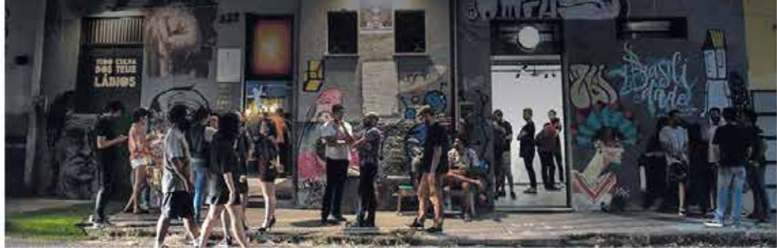
Artistas avaliam a edição "sequestrada" do Salão de Abril, que neste ano foi realizado sem apoio da Prefeitura