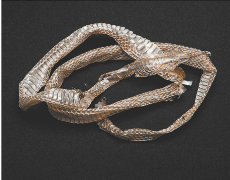
Imagens que integram a exposição "Zona de Litígio", assinada coletivamente por seis realizadores: reflexões sobre pertença, passagem e não-lugar

Um trecho dessa "terra de ninguém" ampliou-se 133 anos depois, como espaço para uma residência artística móvel reali-