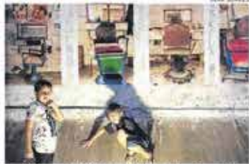
A edição "sequestrada" do Salão aconteceu em espaços como a Vila Vicentina, galeria Ilétric Circus (aba) e Sem Título Arte (abaixo)

Segundo Blü, os artistas que realizaram o Sequestrado se reuniram nesta semana, no Minimuseu Firmeza, para uma avaliação do evento. "Nesse encontro, serão gerados documentos e encaminhamentos da classe das artes visuais. A grande potência desse sequestro metafórico é mostrar como os artistas anseiam por políticas que permitam ações efetivas nas suas linguagens. Não adianta ficar lançando edital se não tem dinheiro pra pagar. É necessário que se pense com mais seriedade na criação das políticas e que se tenha uma abertura para o diálogo",