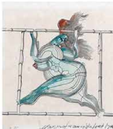
"Sonho de uma abelha ao redor de uma romã um segundo antes de acordar" (Cecília) e projetos dos laboratórios e da exposição "Utopias da Imagem" (Detalhe)

Visuais, Bini Cassandré, "os projetos contribuem de forma valerosa para se pensar o contemporâneo, por meio de uma revisão historiográfica acerca da produção cearense e o Surrealismo; de investigação territorial através de uma linha de ônibus da capital e a partir daí chegar em estratagemas do 'coletivo', tensionar e provocar uma produção que lida com a 'imagem', o 'real', a 'apropriação' e desdobra-la em diferentes mecanismos de resignificação; e discutir a territorialização do isolamento, da margem, da doença, do corpo aprisionado".