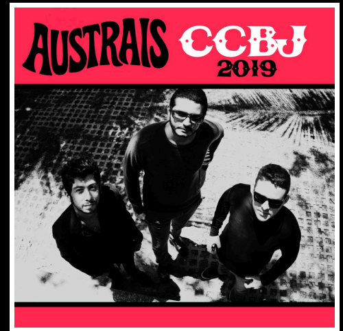
[2019] CCBJ 2019