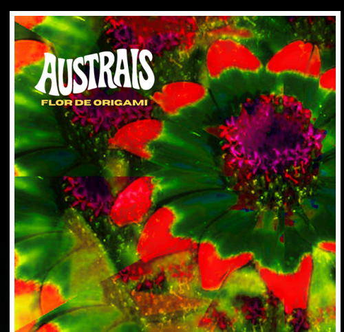
[2025] Flor de Origami