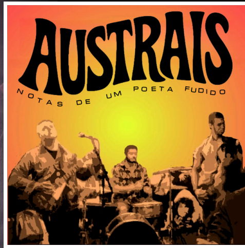
[2016] Notas de um Poeta Fudido