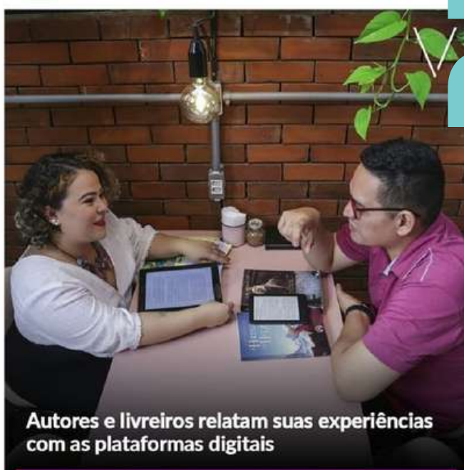
Autores e livreiros relatam suas experiências com as plataformas digitais

https://diariodonordeste.verdesmares.com.br/verso/autores-e-livreiros-relatam-suas-experiencias-com-o-livro-digital-1.2216775