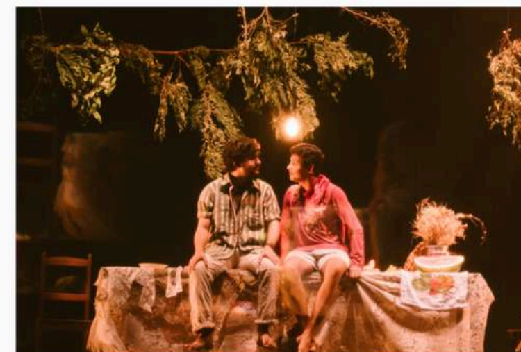
A peça Maçã Mordida, do grupo Teatro Espiral

Cultura janeiro 19, 2025 • Adriele Ribeiro