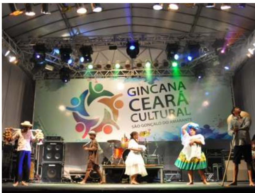
III Gincana Ceará Cultural tem, entre as atrações, apresentações de grupos artísticos.

Inscrições para o evento são gratuitas e livre para todas as idades. Iniciativa tem uma premiação total de R$ 5.000 para os participantes.