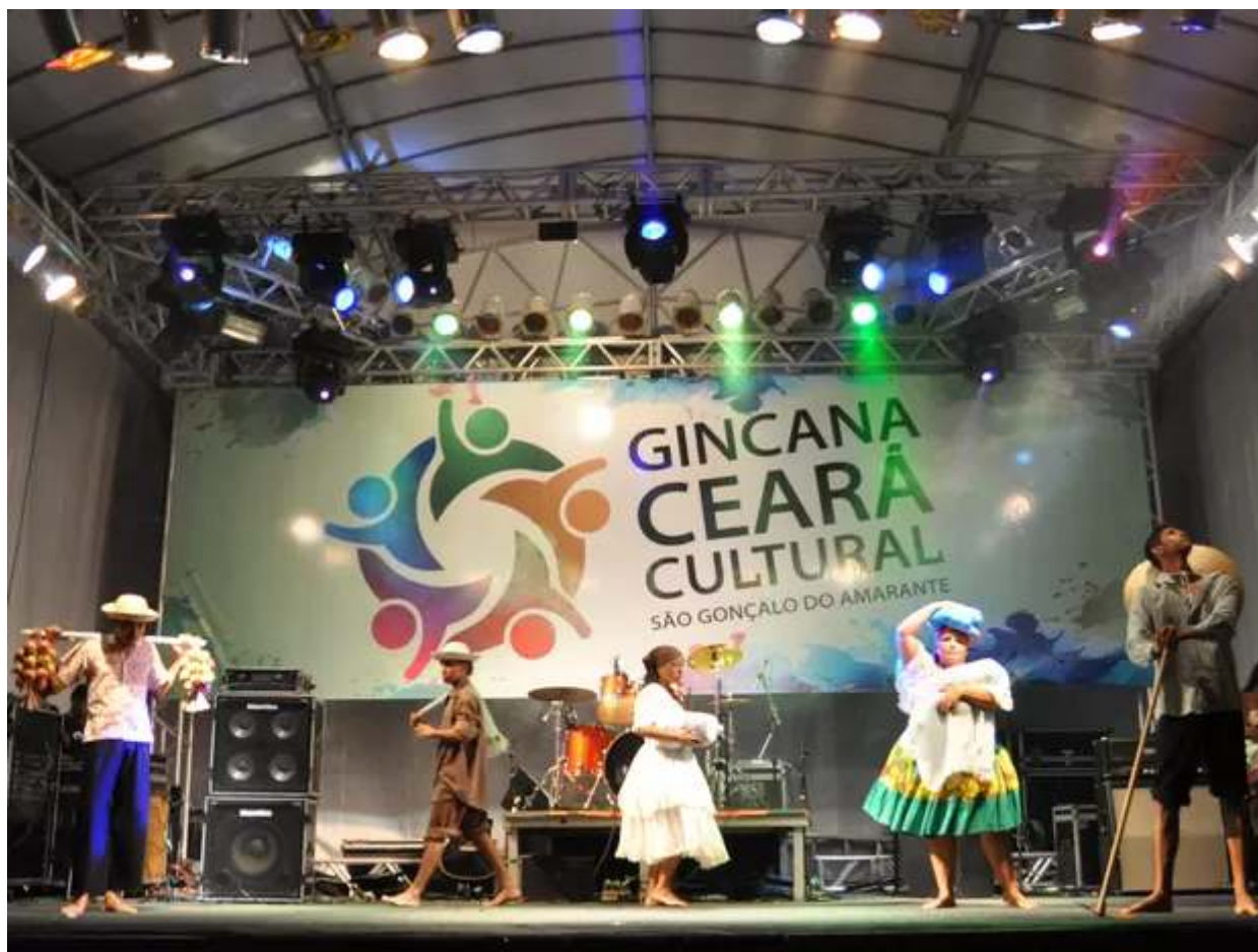
III Gincana Ceará Cultural tem, entre as atrações, apresentações de grupos artísticos.

município de São Gonçalo do Amarante , localizado na Região Metropolitana de Fortaleza , recebe entre os dias 29 e 31 de janeiro, a 3ª edição da Gincana Ceará Cultural. A competição tem como objetivo compartilhar conhecimentos e resgatar valores como solidariedade e coletividade, por meio o entretenimento educativo e muita diversão. As inscrições para participar do evento são gratuitas e livre para todas as idades e classes sociais.