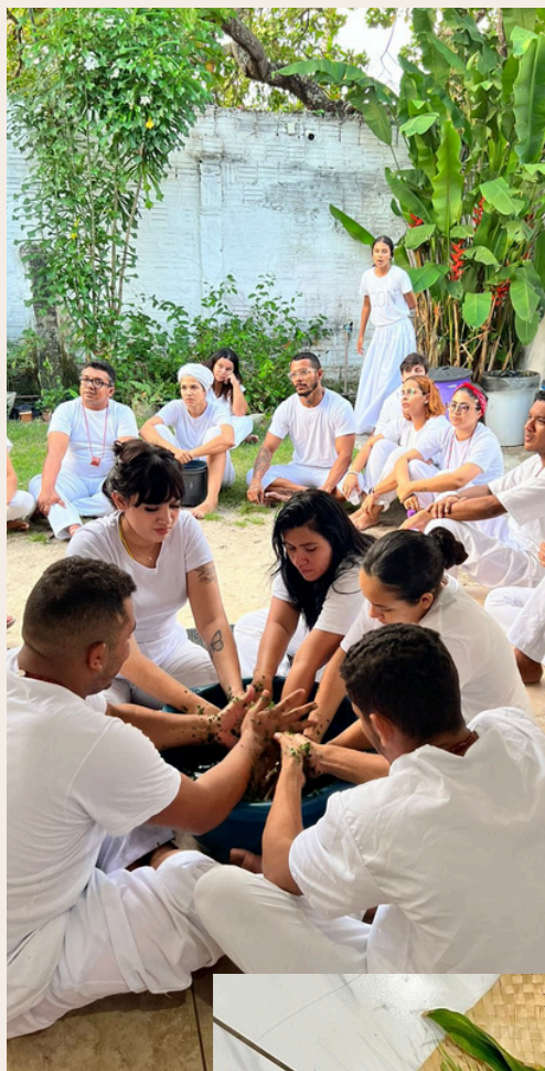
MINISTRANTE DA OFICINA DE ERVAS SAGRADAS