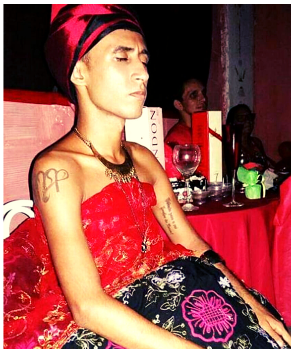
HOMENAGEM A POMBOGIRA Casa Lírío Verde, 2015