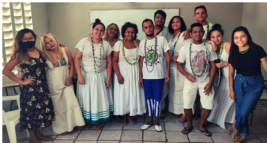
INTEGRANTES TERREIRO AÇÃO SOCIAL, 2019.