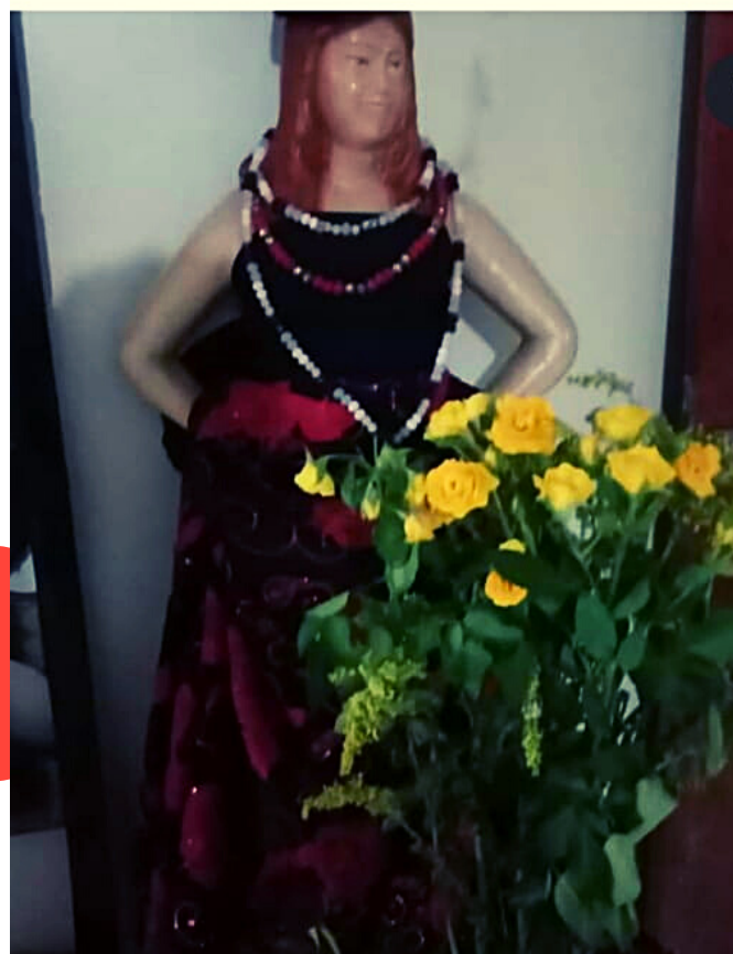
HOMENAGEM A POMBOGIRA Casa Lírio Verde, 2020.