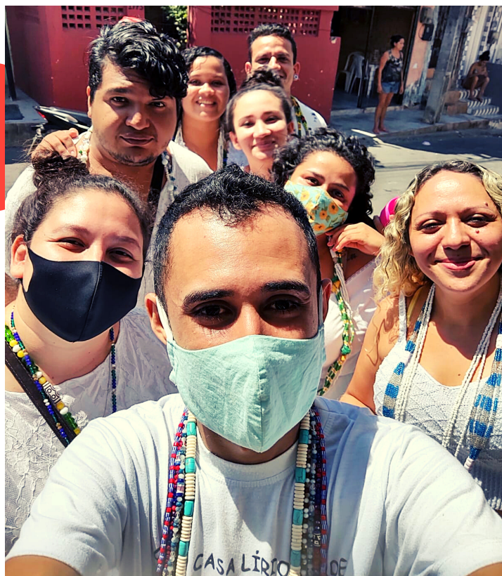
INTEGRANTES TERREIRO TRABALHO DE RUA, 2019.