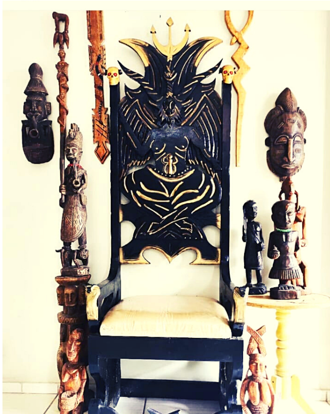
TRONO DE POMBOGIRA ANO 2021