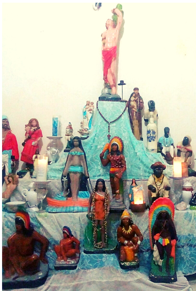
GONGÁ DO TERREIRO BAIRRO JOÃO XXIII