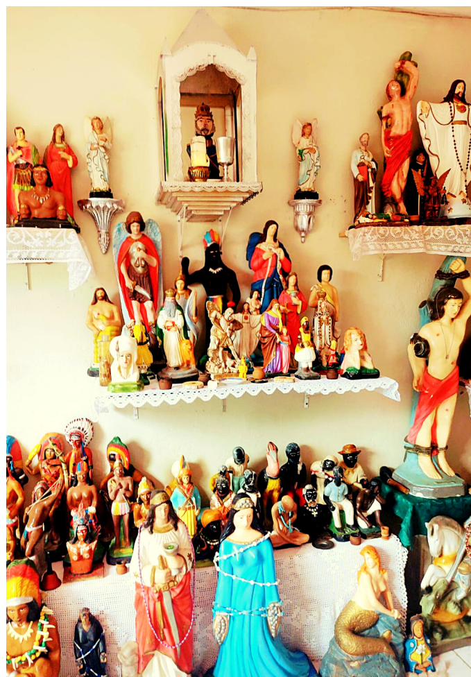
GONGÁ DO TERREIRO CONJUNTO CEARÁ