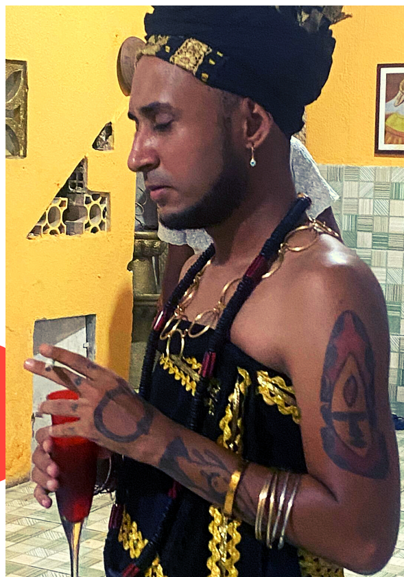
POMBOGIRA DAS ALMAS ASÉ T'MUWÁ, 2021.