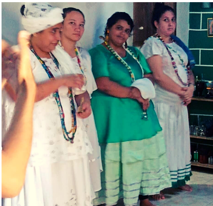
GIRAS LÍRIO VERDE, 2020