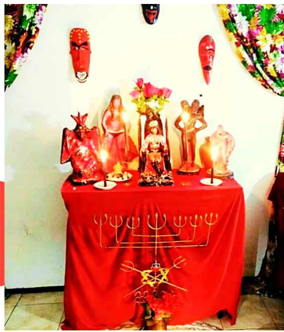
HOMENAGEM A POMBOGIRA Casa Lírío Verde, 2017.