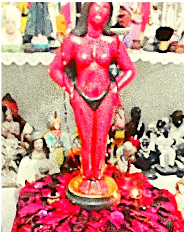
HOMENAGEM A POMBOGIRA Casa Lírio Verde, 2019