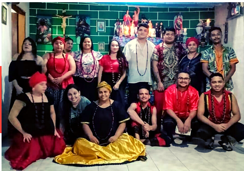
GIRAS DE EXÚ, 2021