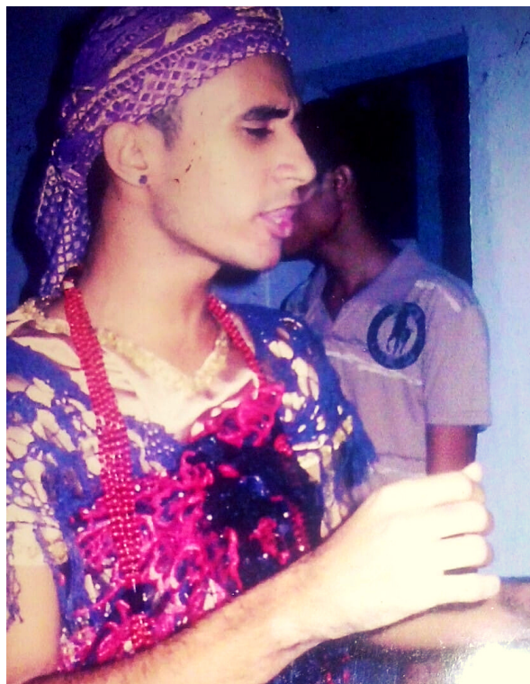
POMBOGIRA DAS ALMAS CASA LÍRIO VERDE, 2010.